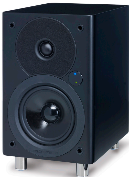
MySPEAKER MyAMP inside Noir: 9MYSPEUV01B EAN : 376018679097 9