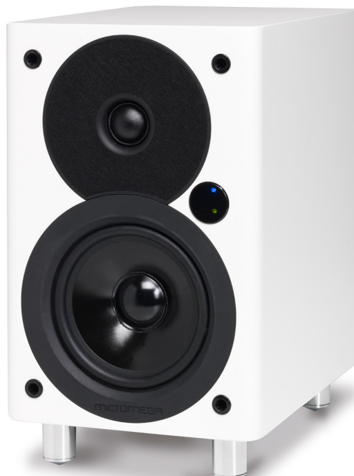
MySPEAKER MyAMP inside Blanc: 9MYSPEUV01W EAN : 376018679098 6